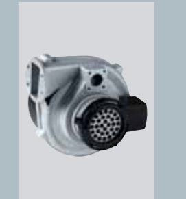
Radialgebläse mit Lambda-Constant® System für intelligente Brennwertechnik